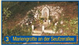
3 Mariengrotte an der Seufzerallee