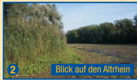
2 Blick auf den Altrhein