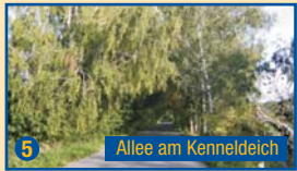
5 Allee am Kenneldeich