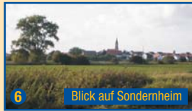
6 Blick auf Sondernheim