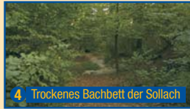
4 Trockenes Bachbett der Sollach