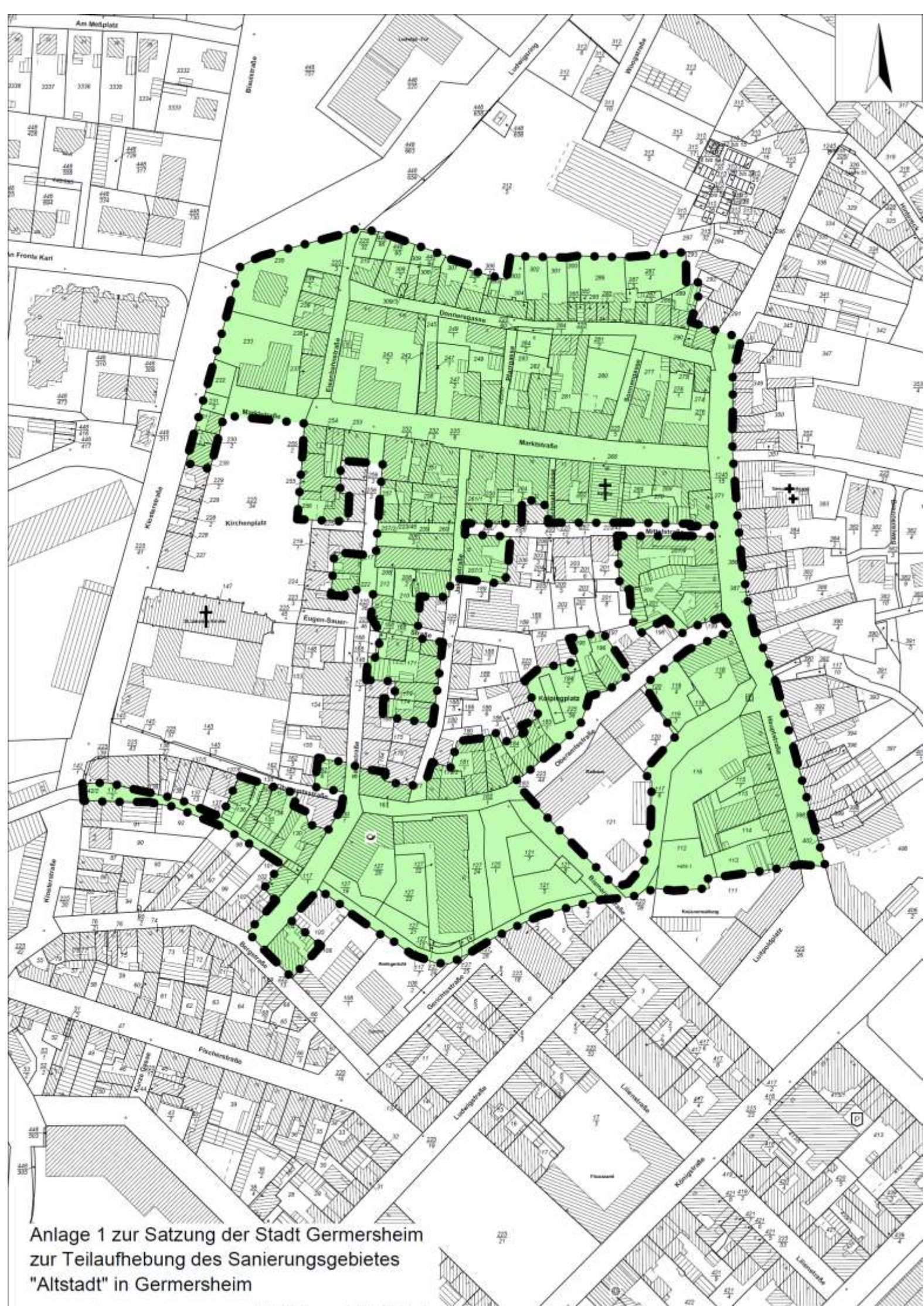
Anlage 1 zur Satzung der Stadt Germersheim zur Teilaufhebung des Sanierungsgebietes "Altstadt" in Germersheim