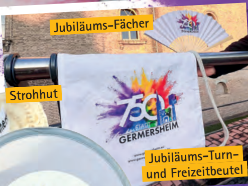
Jubiläums-Turn- und Freizeitbeutel