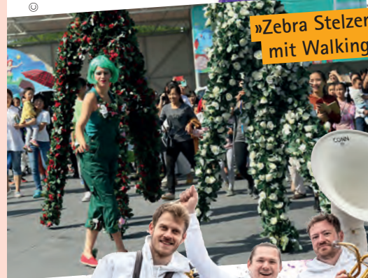
»Zebra Stelzentheater« mit Walking Roses