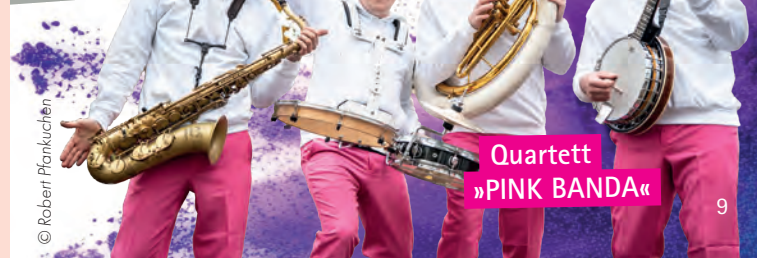
Quartett »PINK BANDA«