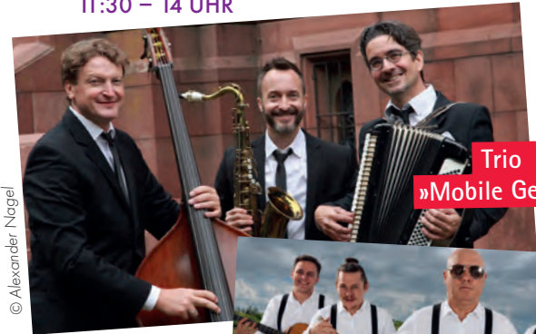
Trio »Mobile Gentlemen«